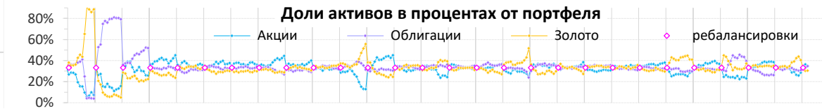
Доли активов в процентах от портфеля