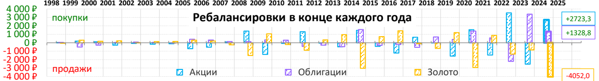
Ребалансировки в конце каждого года